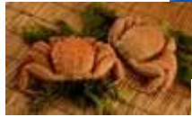
涼風吹きぬける 夏の阿寒湖