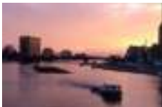
涼とともに心を癒す 釧路の美しい夕景

ホテル(シングル)相場 119,400~240,000 円程度/月 1DK物件 相場 85,000~100,000 円程度/月 2DK(アパート) 相場 121,000~145,000 円程度/月