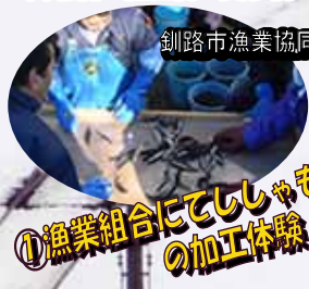
釧路市漁業協同組合

旅行代金に含まれるもの: 行程に明記されたJR代・バス代・入場料・宿泊代・食事代・添乗員同行費用・消費税等諸税