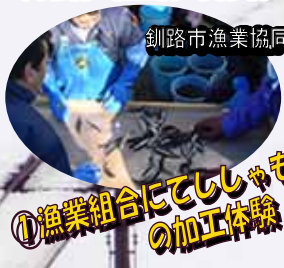
釧路市漁業協同組合

旅行代金に含まれるもの: 行程に明記されたJR代・バス代・入場料・宿泊代・食事代・添乗員同行費用・消費税等諸税