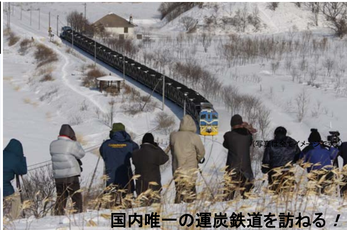
国内唯一の運炭鉄道を訪ねる！