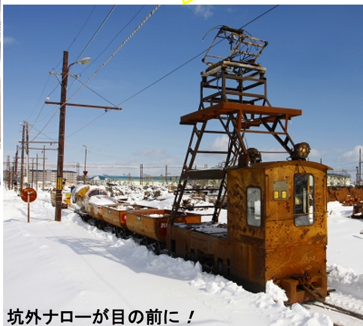
坑外ナローが目の前に！